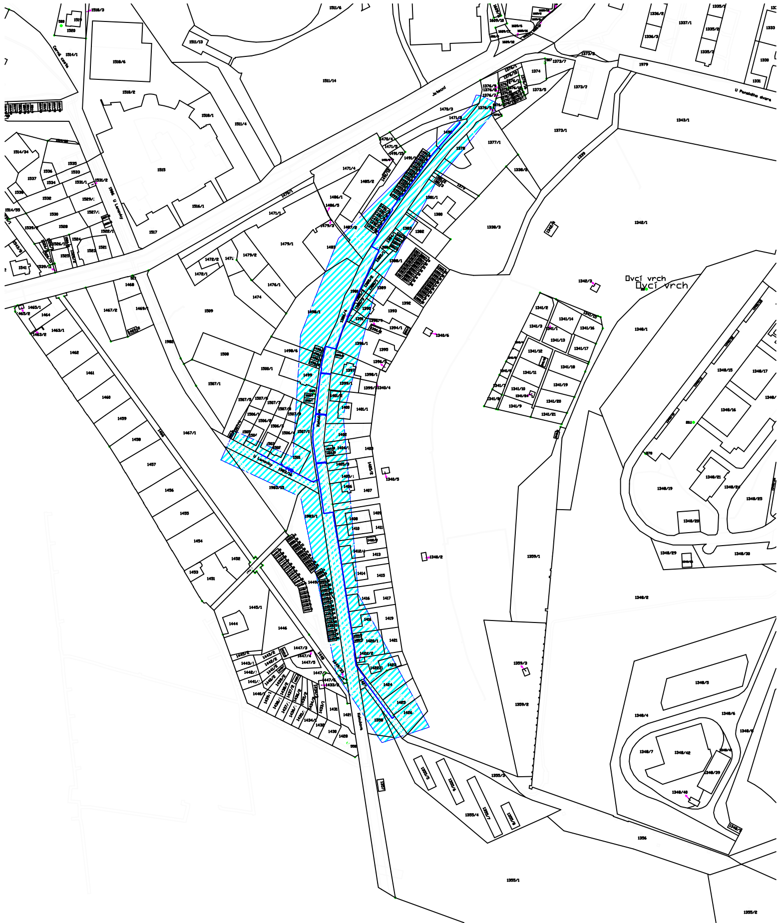
Snímek z katastrální mapy